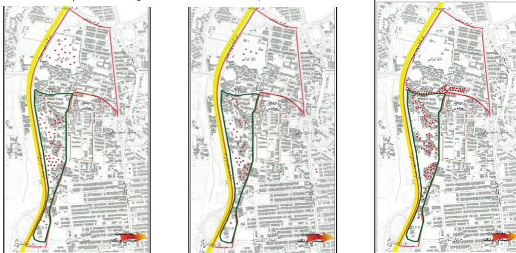
شکل ۱- مکان انجام فعالیت‌های ضروری شکل ۲- مکان انجام فعالیت‌های انتخابی شکل ۳- مکان انجام فعالیت‌های اجتماعی