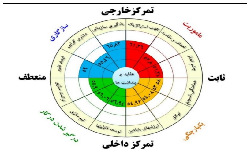
شکل ۱ - تصویر کلی فرهنگ سازمانی در خط یک قطار شهری مشهد - منبع: مطالعات نویسندگان، ۱۳۹۶.

خارجی سازمان را دارای قوای بیشتری نشان می‌دهد و بیان‌گر ارتباطات متقابل بیرونی آن است؛ چرا که ارتباطات بیشتری با شهروندان و سایر سازمان‌ها و نهادهای درگیر در فرآیند خدمت رسانی قطار شهری مشهد وجود دارد. در محور عمودی مدل نیز، سازمان دارای قابلیت بیشتری برای انعطاف و ایجاد تغییرات بر اساس نیازهای متغیر و نه فقط پیروی از دستورالعمل‌های ثابت است.