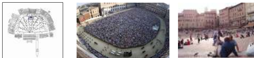
شکل ۱-۴: شکل و نقشه میدان دل کامپو (ماخذ: دوزدوزانی، ۱۳۹۲)

محصوریت بی نظیر، وجود کاخ شهر پابلیکوبا بنای مقرر شکلش در جداره جنوبی، سایه ایجاد شده برج مانیا مانند عقربه یک ساعت آفتابی روی صفحه میدان، نه نوار آجری شعاعی شکل در سنگفرش، وجود آب‌نمای گیاه‌ها در سمت شمال میدان، ممنوعیت ترافیک، نشستن و دراز کشیدن مردم در کف میدان است (کنیرش ۱۳۸۸، ۲۵ تا ۳۴) (شکل ۱-۴).